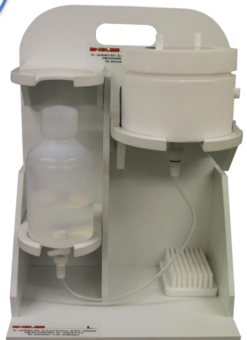
Position de vidange

Le dispositif fabriqué en matériaux fluoropolymères (PTFE, PFA) peut être utilisé avec un très grand nombre de réactifs.