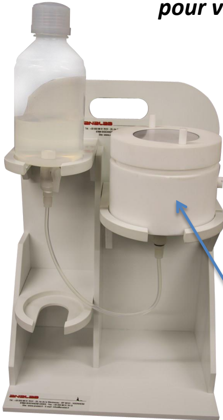
Position de remplissage

Un dispositif de conditionnement à froid simple et efficace pour vos embouts ou cônes de pipettes