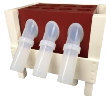
CleanAcids 3-125 mL