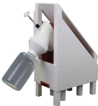
CleanAcids 1000 mL

Appareils de purification permettant d'obtenir des réactifs de haute pureté à partir d'acide de qualité pour analyse, élément essentiel pour les résultats de vos analyses.