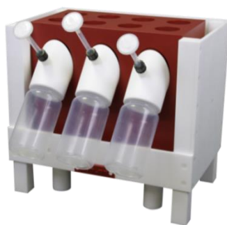
CleanAcids 3-500 mL